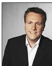
Morten Bødskov (S)