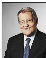
Niels Helveg Petersen (RV)