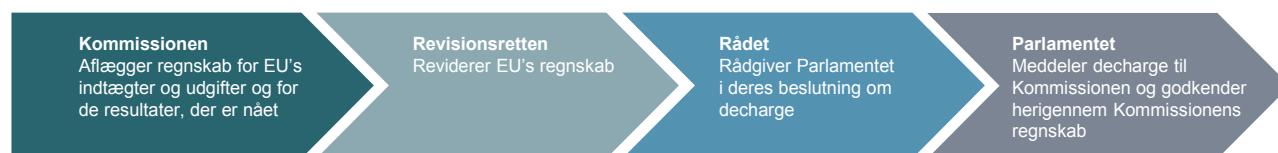
Figur 1. Ansvarskæden for godkendelse af EU's regnskab

7. I forbindelse med dechargen gennemgår Parlamentet og Rådet bl.a. Revisionsrettens årsberetning, revisionserklæring og særberetninger samt de årlige aktivitetsrapporter fra Kommissionen.