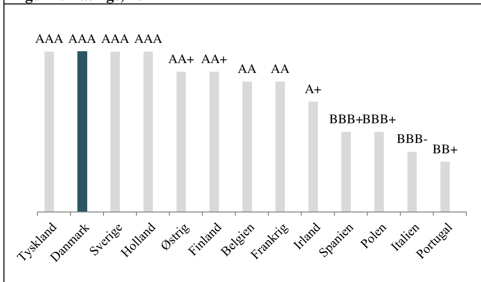
Figur 1. Ratings, 2017