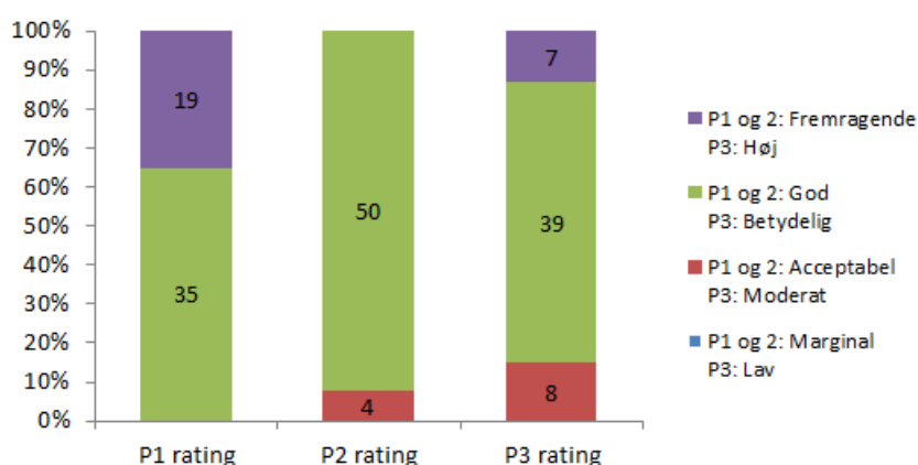
Figur 3: ReM-ratings pr. søjle for nye transaktioner undertegnet i 2016

I 2016 opnåede alle nye projekter mindst en rating som "god" i søjle 1 og lå dermed på linje med ELM's målsætninger om at yde et stort bidrag til enten nationale eller EU's udviklingsmålsætninger og et moderat bidrag til andre. 19 projekter opnåede ratingen "fremragende" for deres bidrag til både EU's og nationale udviklingsmål.