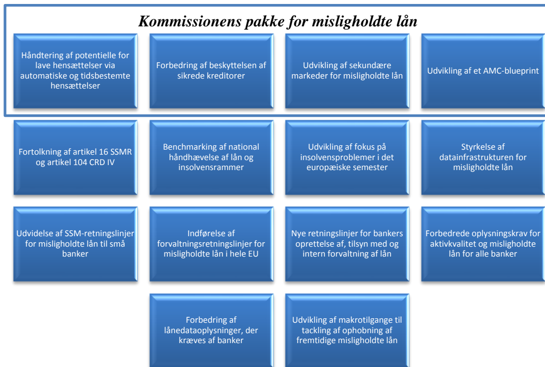
Figur 2: Elementer i Rådets "Handlingsplan for behandling af misligholdte lån i Europa" 20

Hvis misligholdte lån er blevet et betydeligt og bredt baseret problem, kan medlemsstater, som ønsker det, oprette nationale AMC'er eller andre foranstaltninger under de aktuelle regler for statsstøtte og bankafvikling.