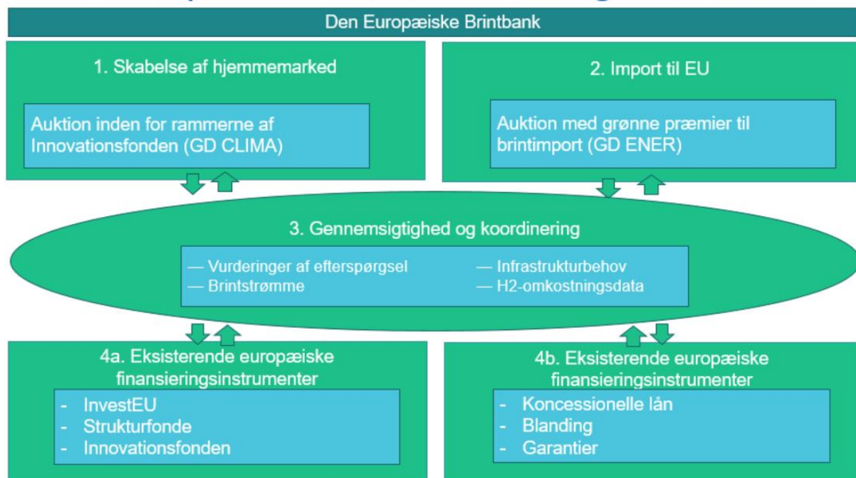
Figur 1. Den Europæiske Brintbanks fire aktivitetssøjler

Banken vil spille en vigtig rolle, fordi den vil mobilisere investeringer fra den private sektor og bidrage til den tidlige skabelse af et marked og prisdannelse ved at skabe konkurrence med hensyn til finansiering såvel som øge tilliden hos investorerne og skabe erfaringer med projektfinsieringen i den private finansieringssektor.