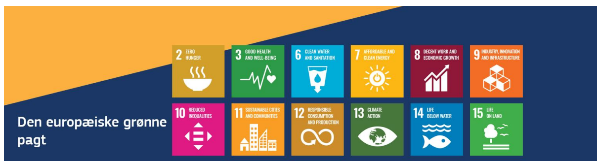
Figur 3: Bidrag til verdensmålene fra den overordnede ambition "den europæiske grønne pagt"

For at gøre afgørende fremskridt med hensyn til klimaindsats (verdensmål 13) er EU for nylig blevet enige om en fornyet lovgivningsmæssig og politisk ramme, der understøtter en højere klimaambition. EU og dets medlemsstater har fuldt ud opfyldt deres internationale klimaforpligtelser om at reducere drivhusgasemissionerne med 20 % senest i 2020 sammenlignet med 1990. Den europæiske grønne pagt stræber efter at gøre Europa til verdens første klimaneutrale kontinent senest i 2050 . Den er udtrykkeligt udformet som en integreret del af strategien for at gennemføre 2030-dagsordenen og verdensmålene 30 .