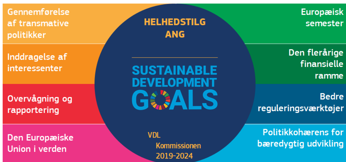
Figur 1: EU's helhedstilgang

Kommissionsformand Ursula von der Leyen fremlagde i begyndelsen af sit mandat politikprogrammet En mere ambitiøs Union 17 — de politiske retningslinjer for 2019-2024. Formandens politiske program integrerer verdensmålene i alle Kommissionens forslag, politikker og strategier. Alle de 17 verdensmål indgår i en eller flere af de seks meddelte overordnede ambitioner. Desuden vil alle kommissærer sikre opfyldelsen af verdensmålene inden for deres politikområde 18 .