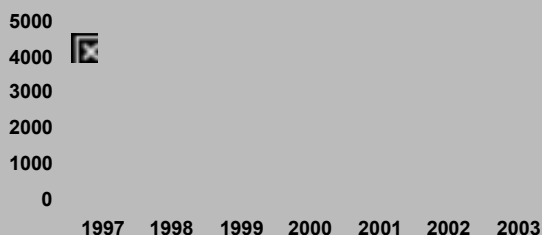
www.euo.dk (gns. besøg pr. dag)

EU-Oplysningens hjemmeside har i 2003 slået alle rekorder. Ikke blot hvad angår det gennemsnitlige antal besøgende pr. dag, men også flest besøg på 1 dag. Højdespringeren