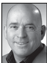
Søren Espersen (DF)