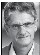
Mogens Lykketoft (S)