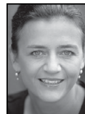
Margrethe Vestager (RV)