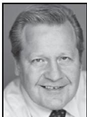
Svend Erik Hovmand (V)