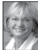
Pia Kjærsgaard (DF)