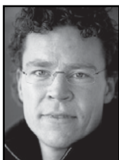
Morten Helveg Petersen (RV)