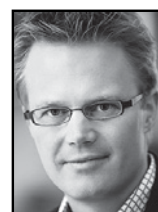
Jeppe Kofod (S) Næstformand