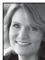
Helle Thorning- Schmidt (S)