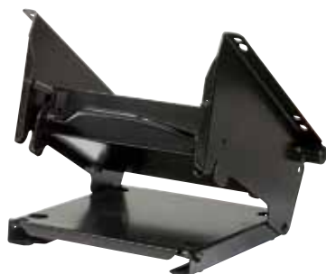
Quick Fitting Konsol vist med bundplade