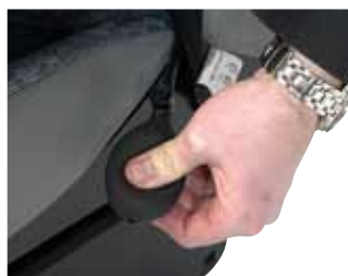
Oppustelig lændestøttepude (air lumbar)

Comfort-sædet kan også leveres med en air lumbar – lændestøttepude, justerbare armlæn og glideskinner.