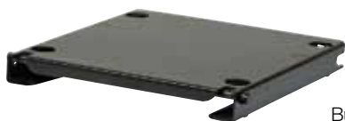
Bundplade til QFC Konsol