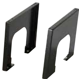
Ben til fast montering, leveres i flere højder