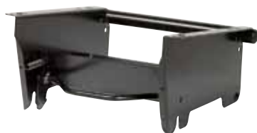
Quick Fitting Konsol (QFC), leveres i flere højder