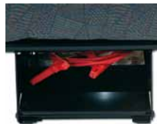
Praktisk opbevaringsrum i QFC underkonsollen