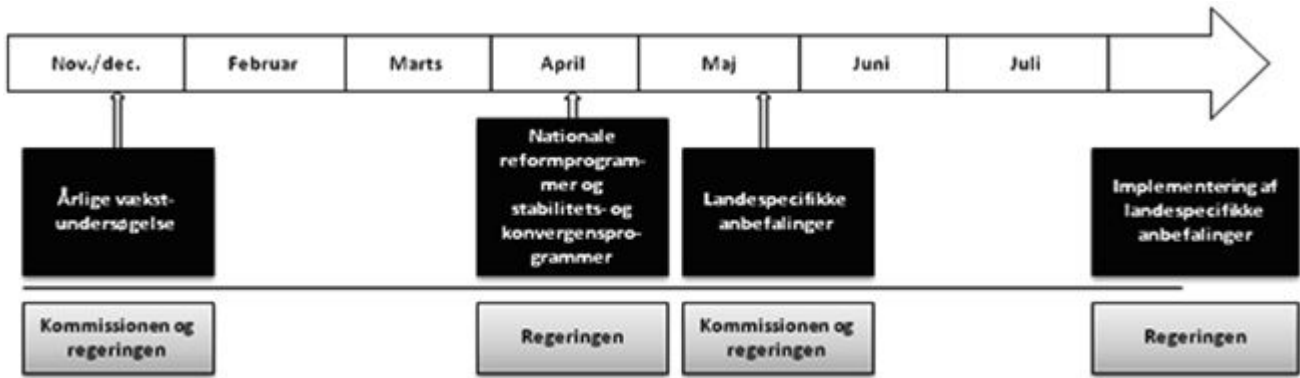
Figur 2: Det »nationale semester«

Derudover kan de to udvalg invitere de økonomiske vismænd og/eller repræsentanter fra Nationalbanken m.fl. til at redegøre for deres økonomiske vurderinger.