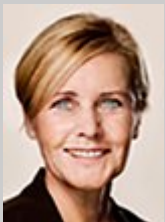
Mette Bock (LA)