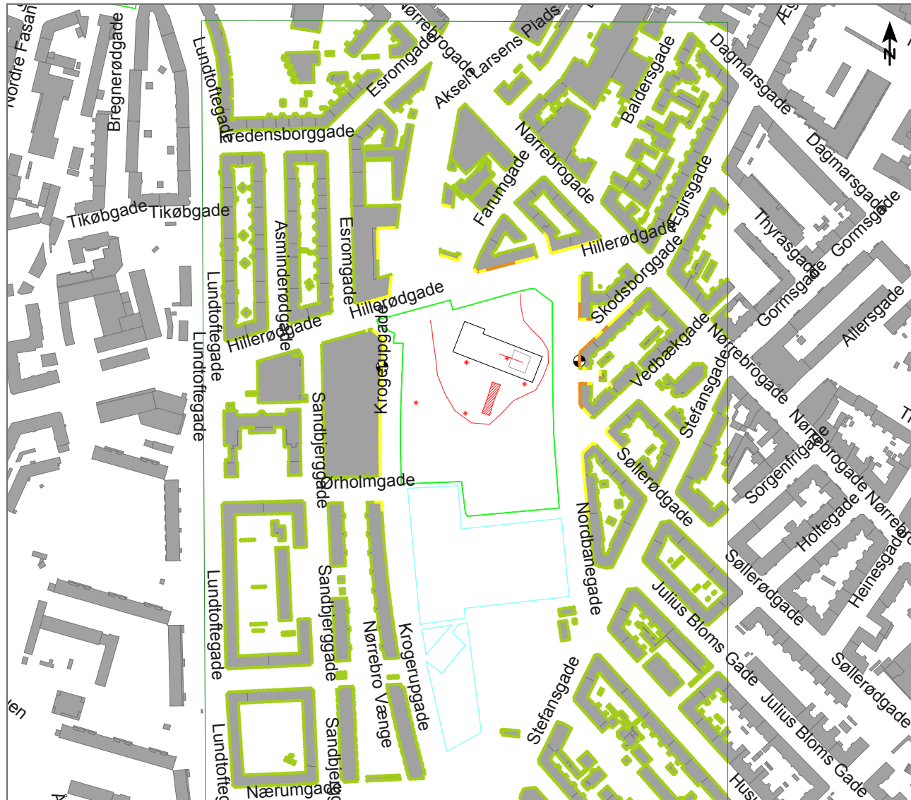
Nørrebroparken. Fase 3-3. Håndtering af muck og tunnelelementer. Dag og aften