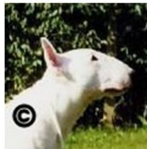
Bull Terrier registreret i Dansk Kennel Klub Danmark