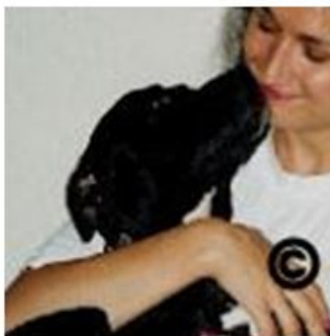
American Pitbull Terrier registreret i United Kennel Club USA

Borgere med lovlige og velfungerende hunde, hvis udseende afviger fra hunde på forbudsliste, standses af politiet og afkræves dokumentation for oprindelse