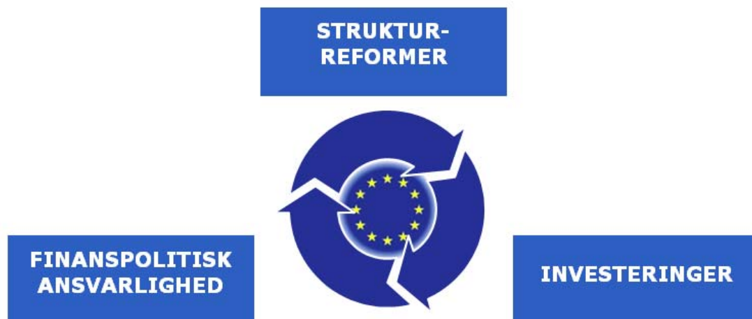
Figur 1. En integreret tilgang

Det er vigtigt, at der handles simultant på alle tre områder for at genoprette tilliden, mindske den usikkerhed, der hæmmer investeringerne, og få mest muligt ud af de indbyrdes forstærkende virkninger mellem de tre grundpiller. Det er især tydeligt, at der er behov for fornyet engagement i gennemførelsen af strukturreformer, hvis vi skal sikre de offentlige finansers bæredygtighed og mobilisere investeringer.