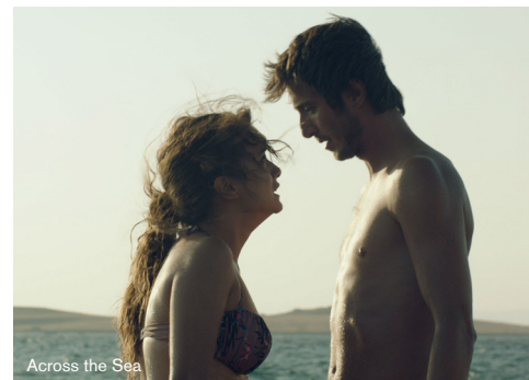
Across the Sea

ARR: Mød filmens producer efter visningen 15. oktober.