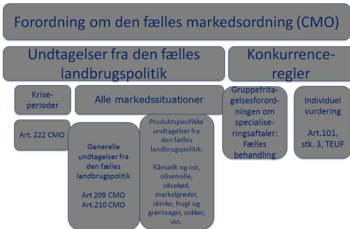
Figur 1 Konkurrenceregler før 1.1.2018