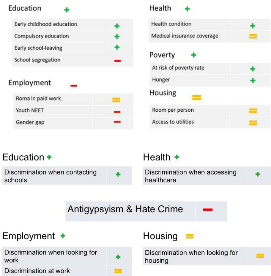
Diagram 2: Ændringer af romaernes situation på de enkelte politikområder og med hensyn til fattigdom i perioden 2011-2016; forskelsbehandling pr. område samt sigøjnerhad