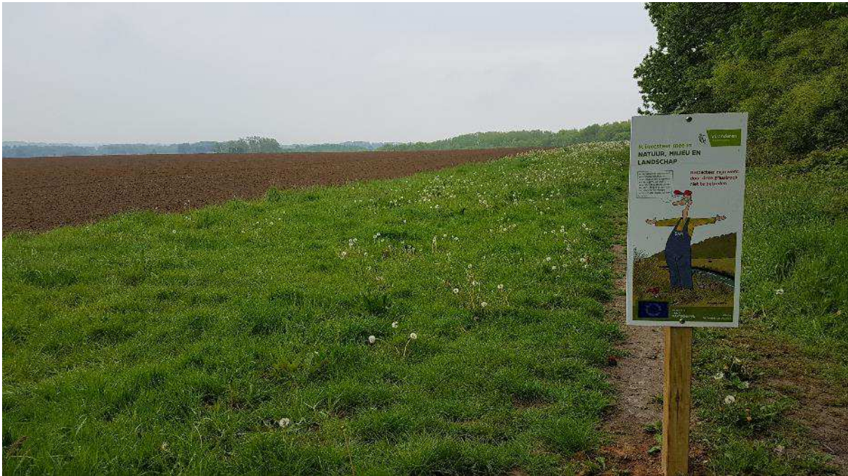
En EU-medfinansieret kontrakt om arealforvaltning, der beskytter biodiversitet.

i de seneste tre år. Der er også gjort fremskridt med forvaltningskontrakter, som bidrager til kulstofbinding eller -bevaring eller til at mindske drivhusgas- og ammoniakemissioner. På nuværende tidspunkt er over 85 % af målene for klimaforanstaltninger i landbrugssektoren allerede nået i forvaltningen af biodiversitet, jordbund og vand.