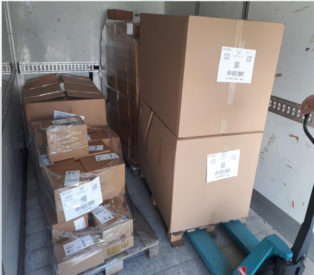
FOTO 6 – her vejer de mere end 11 kg, der var ingen tilladelse. Han fik en bøde men kom videre, fordi han åbnede og flyttede kasserne