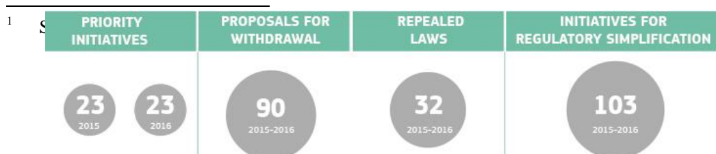
Figur 1. Bedre lovgivning i tal for 2015-2016

Næsten to år efter sin tiltrædelse er Kommissionen på vej til at opfylde vores tilsagn om bedre lovgivning. Fra starten har vores arbejde taget afsæt i en række målrettede politiske retningslinjer 1 for den mellemsigtede indsats over for EU's vigtigste udfordringer: beskæftigelse, vækst og investeringer, migration, sikkerhed, den digitale sektor, energi og udbygning af det indre marked. Hvert år fastlægges der konkrete foranstaltninger, som afspejler disse strategier, i de årlige målrettede og strømlinede arbejdsprogrammer. Arbejdsprogrammet for 2014 omhandlede 100 initiativer. I 2015 indgik der 23 nye prioriterede initiativer og pakker i arbejdsprogrammet. I 2016 var tallet også kun 23.